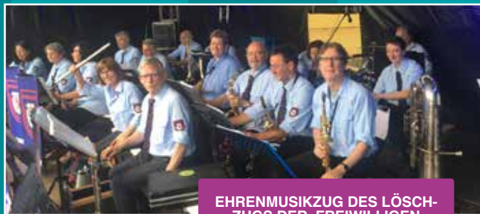
EHRENMUSIKZUG DES LÖSCH- ZUGS DER FREIWILLIGEN FEUERWEHR RONSDORF