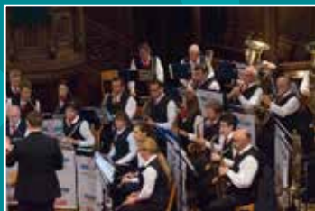
DAS BUNDESBAHN- ORCHESTER