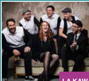
LA KAWA BANDA

Unter diesem Motto heizt die Wuppertaler Coverband mit ansteckender Live-Energie dem Publikum so richtig ein. Die Musikauswahl reicht von den Kultsongs der 60er bis hin zu den Hits der 2000er. Hier ist für jeden das Richtige dabei.